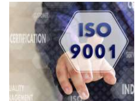
Συστήματα πιστοποίησης ποιότητας